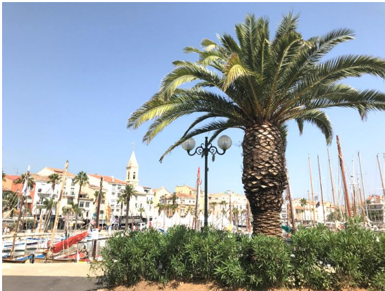
Hafen von Sanary-sur-Mer

Seit 1973 sind Sanary-sur-Mer und Bad Säckingen partnerschaftlich verbunden. Der Freundeskreis wurde 1991 gegründet.