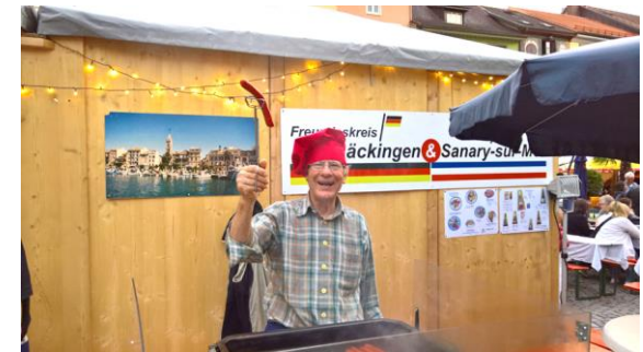
Stand des Freundeskreises am Brückenfest