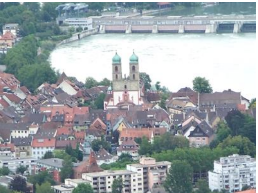
Bad Säckingen von oben