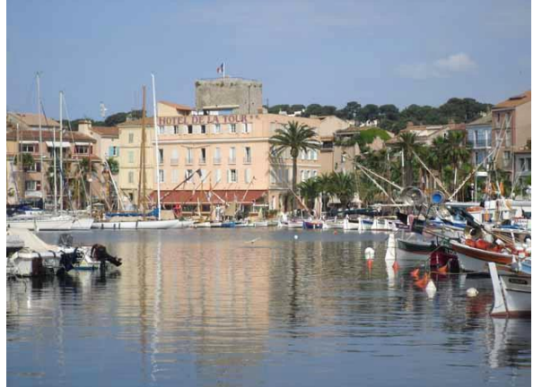
Hafen von Sanary-sur-Mer